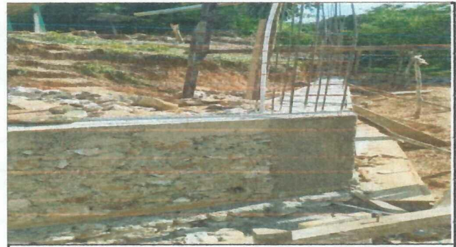
Foto 6: Activación del muro de contención, con un avance del 80%.

Observación: Si es necesario se pueden agregar hojas adicionales y actualizar el número de hojas.