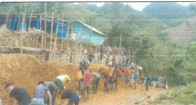
Foto 5: Acitvación del muro de contención, con un avance del 60% de la pate frontal derecha.