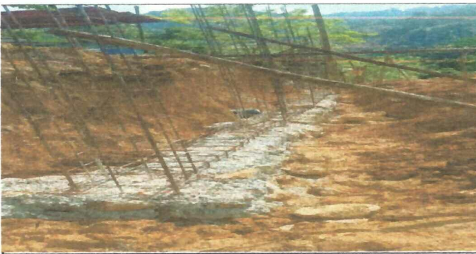
Foto 3: Activación del muro de contención, cimentación con un avance del 15%