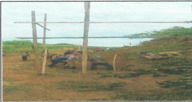
Foto1: Reactivación de zanjeado para el muro de contención alrededor de las instalaciones del centro educativo.