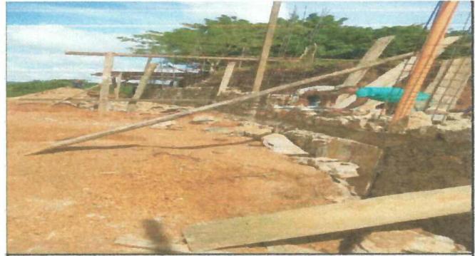
Foto 2: Reactivación del muro de contención, elaborado por los padres de familia, con un avance del 10%